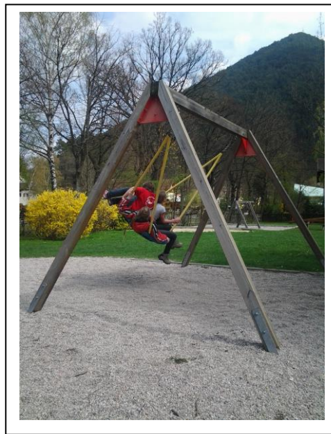
Danach spielen wir noch ein wenig.