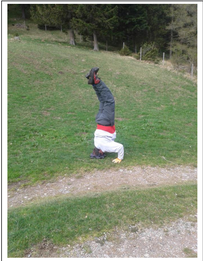
Was der Obi alles kann!