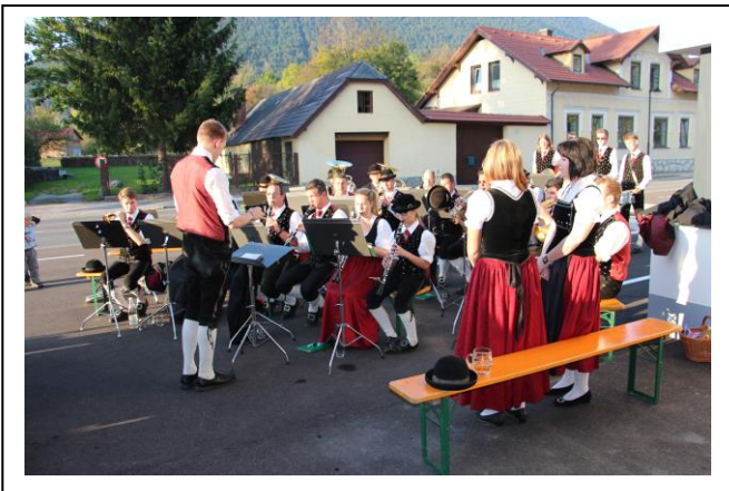
Sie feiern mit und freuen sich wenn Papa spielt.