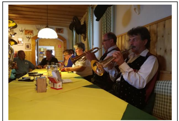
Ein Besuch im Berghaus durfte nicht fehlen und danach fuhren wir zum Essen zur „Wuchtlstation“.