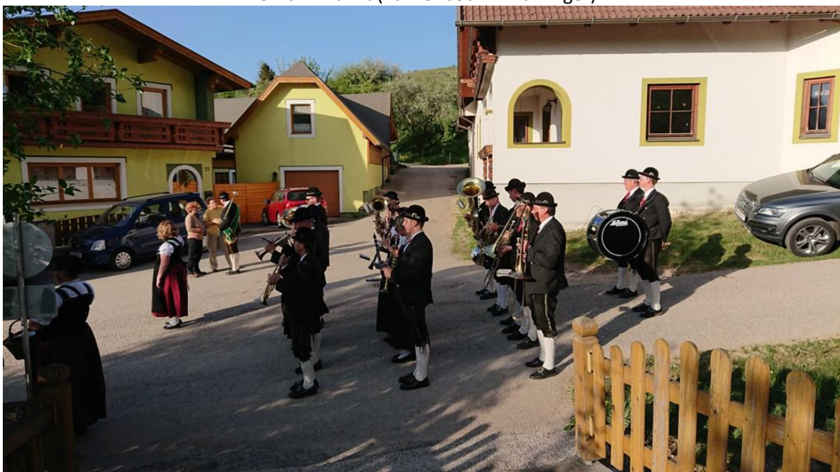
In Pfennigbach beim „Keckerhaus“ und „Koimaun“