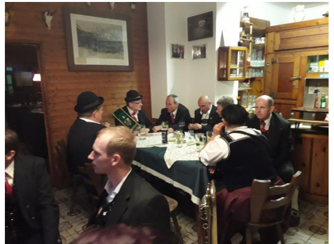
Zum Schluss sind wir wie immer beim „Fisch“ GH Pichler – Alber Krumböckhof. Wir bedanken uns für die vielen, vielen Sach-, Essen-, Getränke- und Geldspenden.