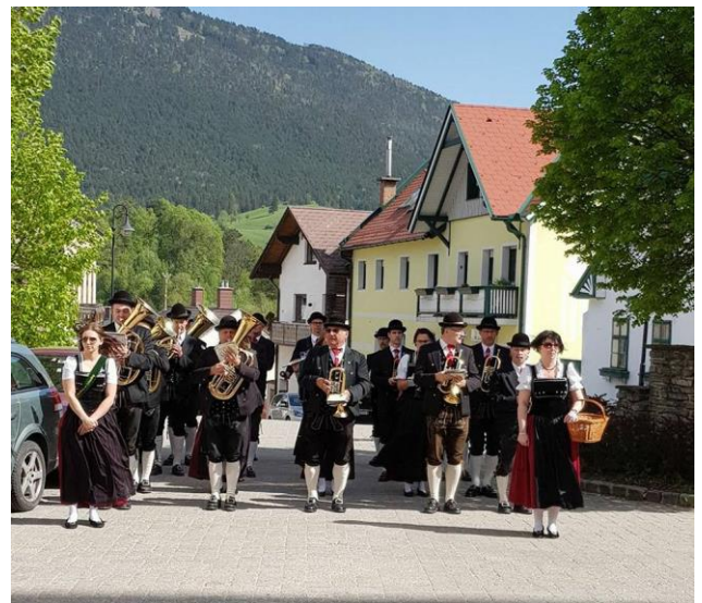
Beim Einzug in die Kirche und nach der feierlichen hl. Messe.