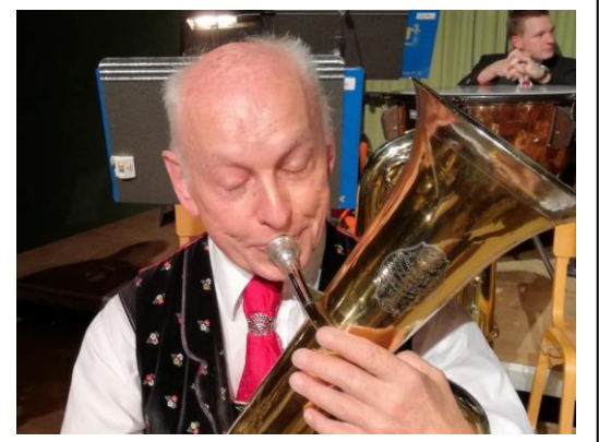
Sie werden immer einen Ehrenplatz bei der Trachtenkapelle Puchberg einnehmen.