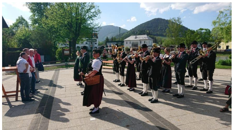
Maifeier der SPÖ Ortsorganisation Puchberg