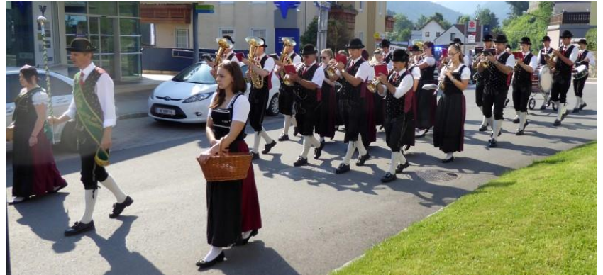
Anmarsch zum 1. Altar