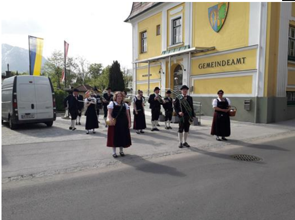
Vor dem Gemeindeamt