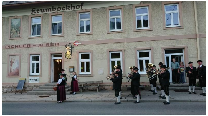
„Fisch“ GH Pichler – Alber Krumböckhof.