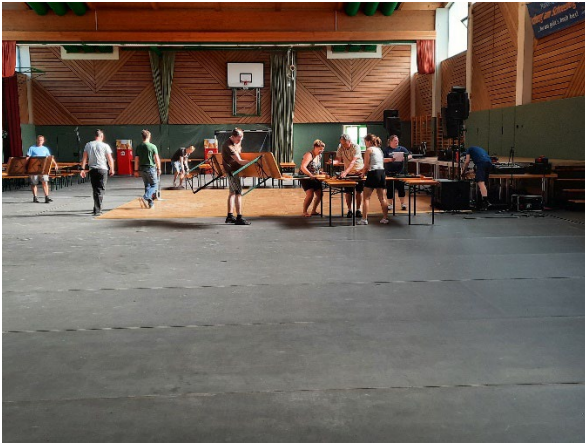
Die Schneeberghalle wird eingräumt!