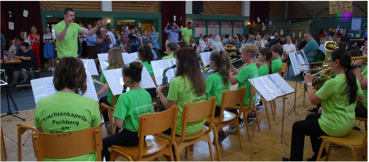
Danach Konzert dem Jugendorchester der TKP