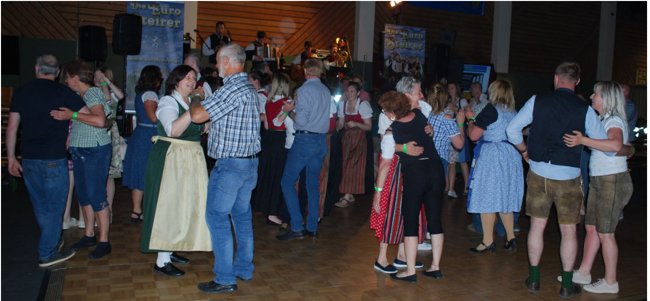
Danach: Tanz mit den Euro Steirern.