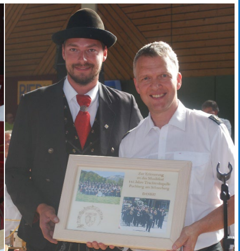
MV Bergknappenkapelle Grünbach mit ihrem Geschenk.