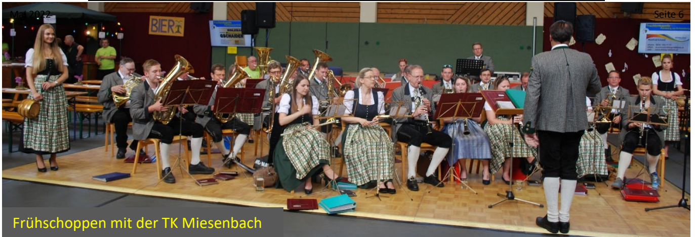
Fröhshoppen mit der TK Miesenbach