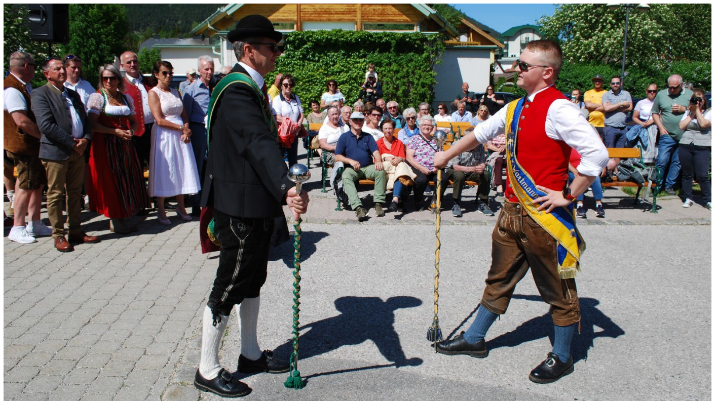
Der Stabführer des MV Wartmannstetten bei der Meldung.