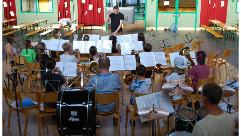
Unsere Jugend bei der Probe für das Sonntagskonzert.