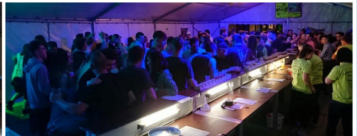
Abendstimmung im Partyzelt