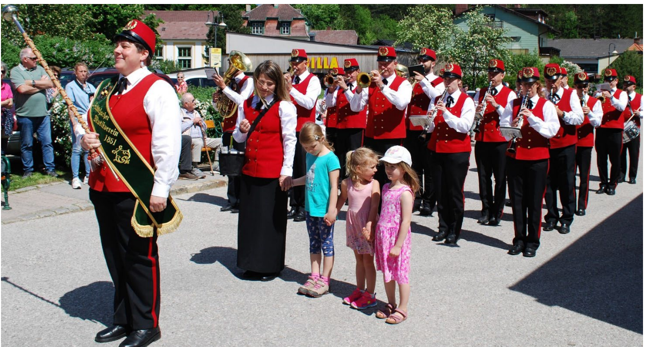
Der 1. MV Pottschach marschierte mit seinen Nachwuchs an.