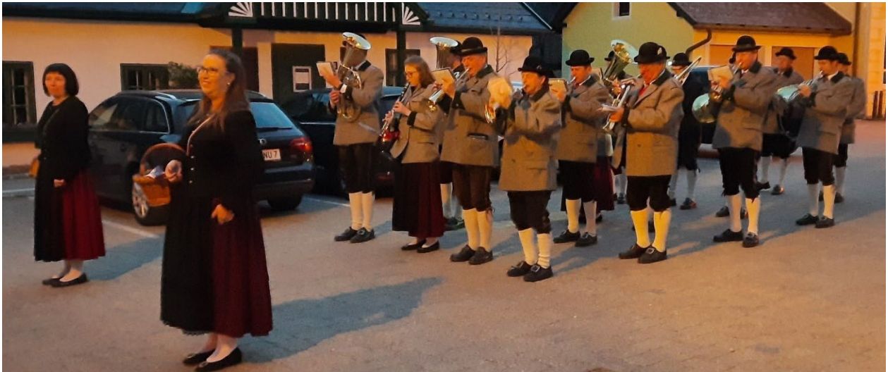
5.00 Uhr morgens am Kirchenplatz