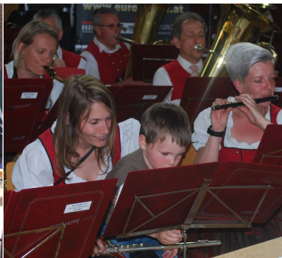
Welche Noten spielt Mama bei der TK Platz.