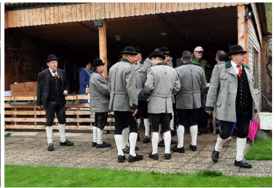
Fünfter Imbiss in der Schwertwiesengasse.