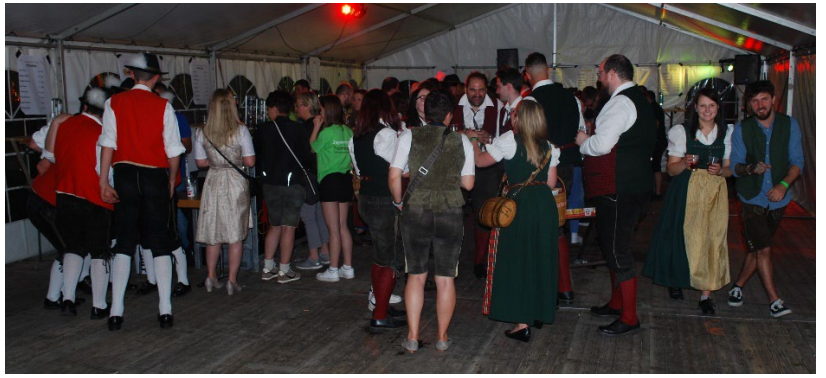
Die Stimmung in der Halle (mit MV Hochneukirchen)