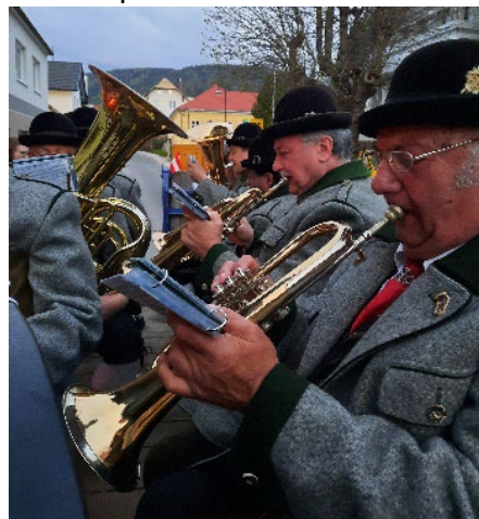
Danach wurden wir vom AX auf seinen Tieflader „chouffiert“.