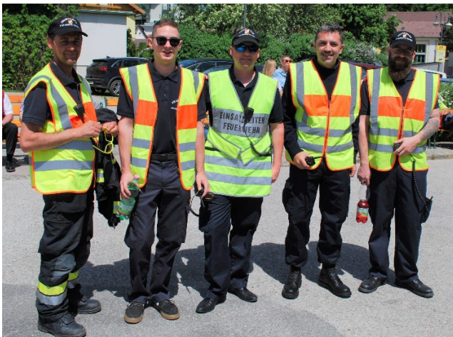
Die FF war für den Abmarsch der Gastkapellen verantwortlich.