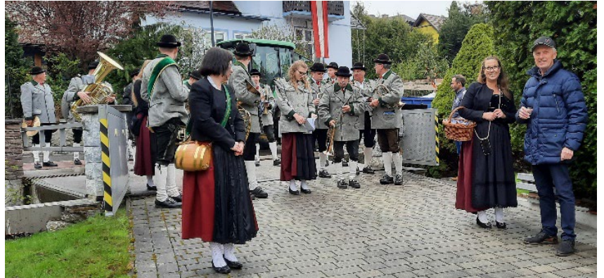
Danach ein Ständchen für unseren Hr. Bürgermeister.