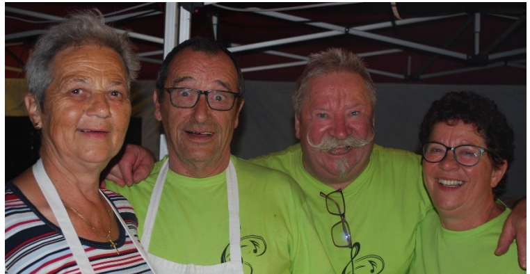
Die Teams hinter den „Kulissen“: Die „Cleaner“ (Geschirreiniger/innen), und die Küchenprofis.