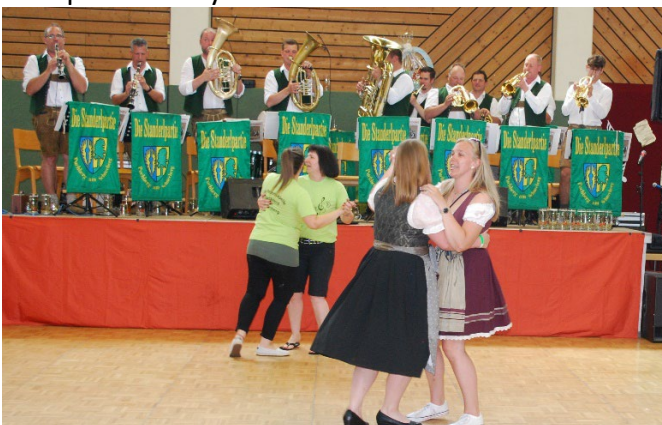
Den Ausklang spielte die Standerlpartie!