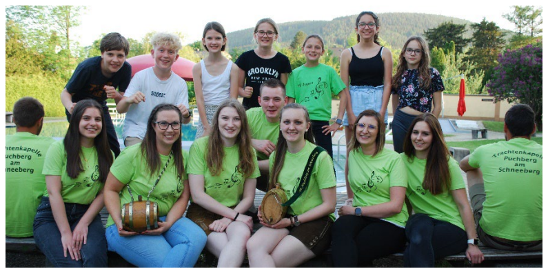
Das Barteam mit den Musikernachwuchs.