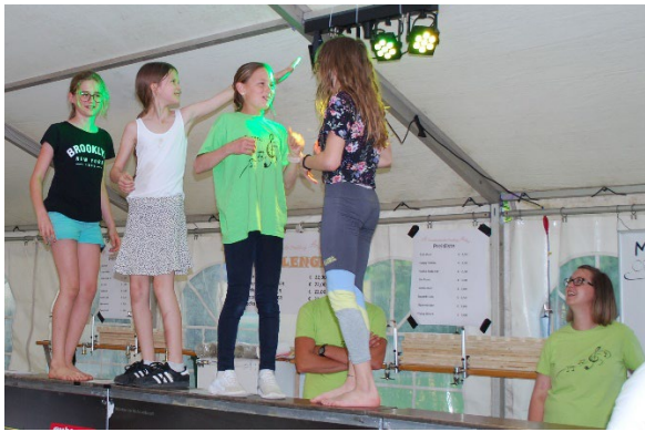
Im Aufgestellten Barzelt tanzten die Kids.