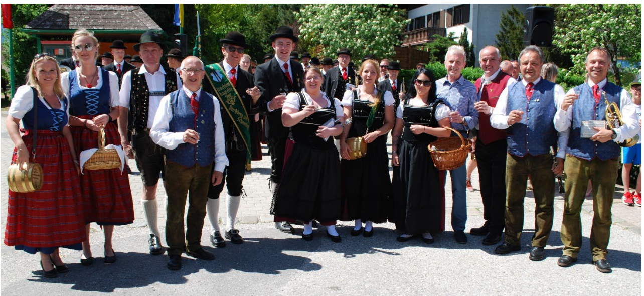
Die erste Kapelle war der Musikverein Pernitz