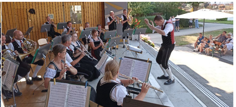
Die Musikerinnen und Musiker auf der Bühne.