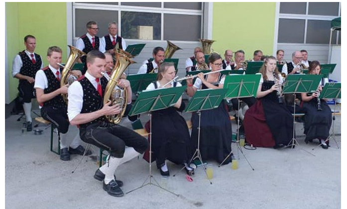
Anmarsch und Konzert bei Fam. Tisch (Landmaschinentechnik).