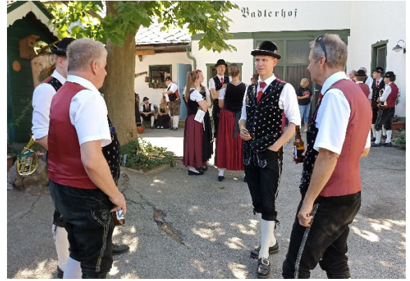
Abmarsch war am Langseitenweg und die 1. Pause beim „Badlerhof“ (Fam. Stickler),