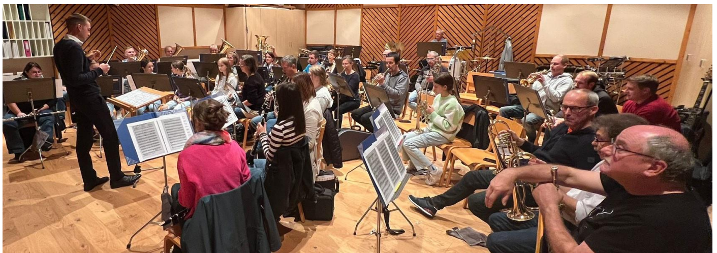
und jetzt von links vorne gesehen.