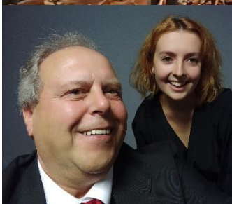
Das Bezirksjugendorchester in der Stadthalle Ternitz.