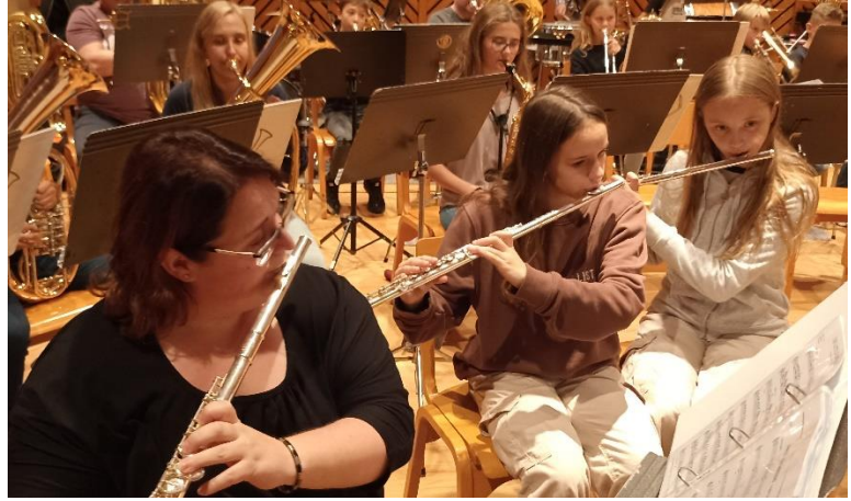
den Querflöten und der Saxophonistin im Hintergrund.