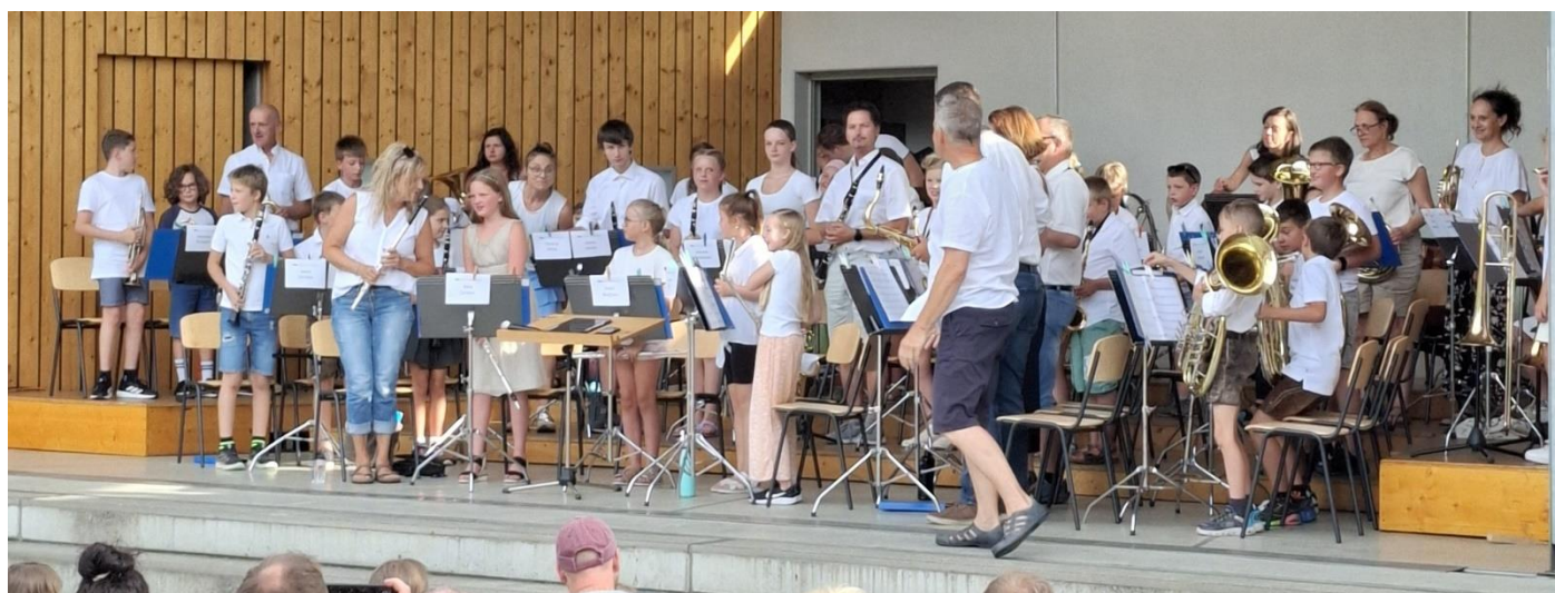
Die Musiker, ca. 50 Nachwuchsmusiker mit ihren Lehrern. Diese haben dieses Bläsercamp in ihrer Freizeit organisiert.