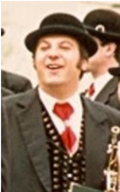
1987-05-31 6. Sänger u. Musikantentreffen