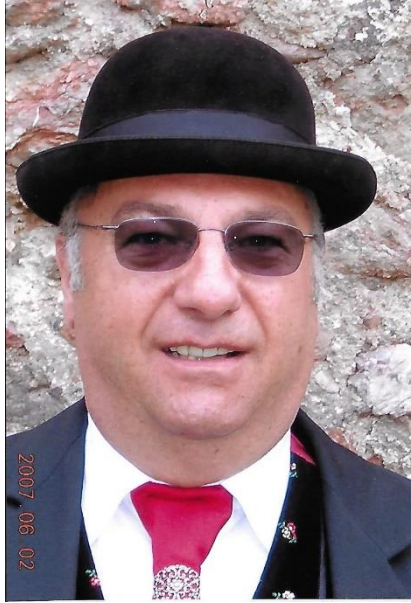
2007-06-02 130 Jahre TKP