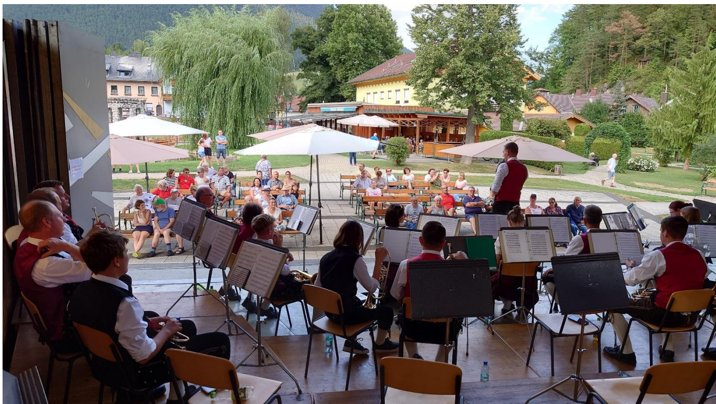
Der Schlagwerker hat alles im Blick.